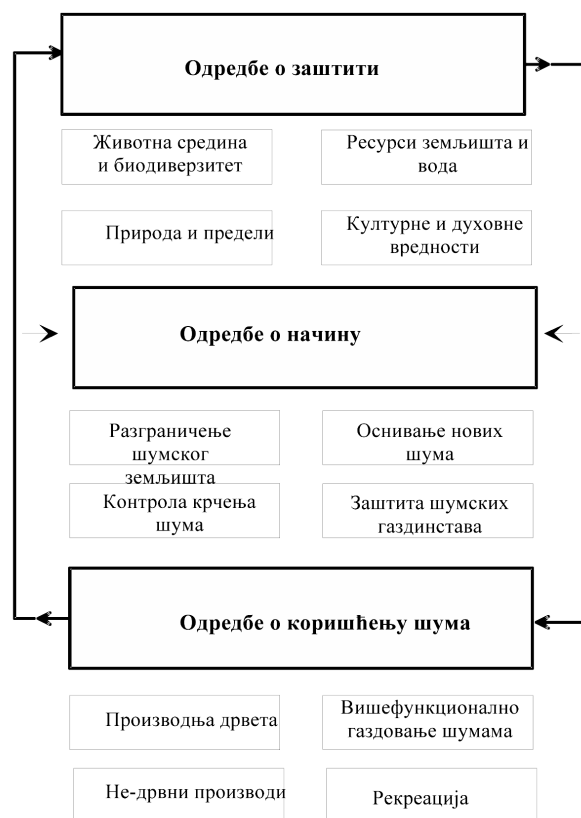
Слика 1. Закон о шумама ређулише заштитију, начин коришћења земљишта и коришћење шума

У том смислу, значајни су следећи принципи: